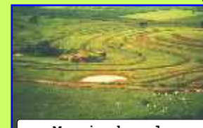
Manejo de solo

Consiste na execução de serviços de manejo e conservação de solo, com construção de bacias coletoras de águas pluviais, junto às estradas rurais, terraços e curvas de nível, para redução da erosão e assoreamento da Bacia do Ribeirão Lajeado. Este trabalho atende principalmente aos pequenos e médios proprietários rurais, de toda a Bacia do Ribeirão Lajeado.