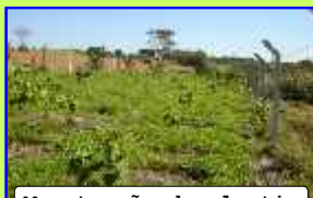
Manutenção do plantio