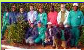
Equipe de servidores

O Consórcio foi criado para ajudar a combater a erosão e o assoreamento da bacia hidrográfica do Ribeirão Lajeado, através do manejo de solo, plantio de espécies nativas e manutenção destas áreas pela equipe de campo, proporcionando, assim, água em quantidade e qualidade à população penapolense.