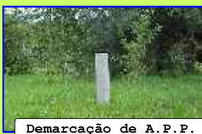
Demarcação de A.P.P.

O Consórcio, ao longo de sua existência, demarcou toda a área de preservação permanente (A.P.P.) do Ribeirão Lajeado e seus principais afluentes.