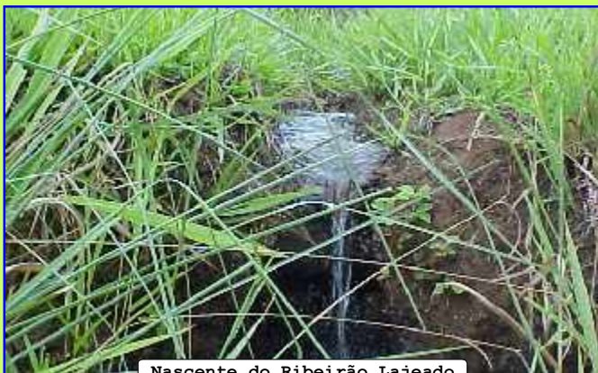
Nascente do Ribeirão Lajeado

O Consórcio Intermunicipal Ribeirão Lajeado está promovendo a revitalização das nascentes do Ribeirão Lajeado e de seus principais afluentes como o córrego do saltinho do Galinari, córrego do Santana e córrego do Araponga.