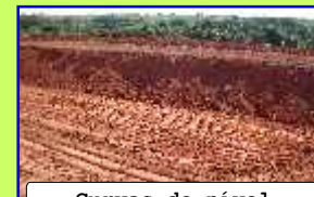
Curvas de nível