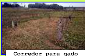
Corredor para gado

Consiste em uma faixa de terra com acesso ao curso d'água entre a APP e a propriedade para que o gado possa beber água sem que a faixa de APP seja prejudicada pelos animais.