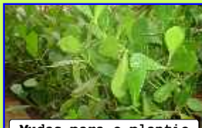
Mudas para o plantio

Consiste no plantio de mudas nativas em toda a A.P.P. (Área de Preservação Permanente) da bacia hidrográfica do Ribeirão Lajeado, com espécies pioneiras e secundárias, mediante levantamento da flora de nossa região.