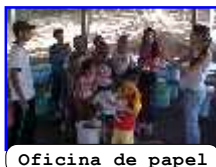
Oficina de papel

O CEA foi criado em 1994 com o objetivo de sensibilizar, incentivar e apoiar as ações ambientais no município. Desenvolve trabalhos com as redes: municipal, estadual e particular de ensino de toda a região através de palestras, cursos, oficinas, teatros (inclusive fantoche) e monitoramentos diferenciados e pré-agendados.